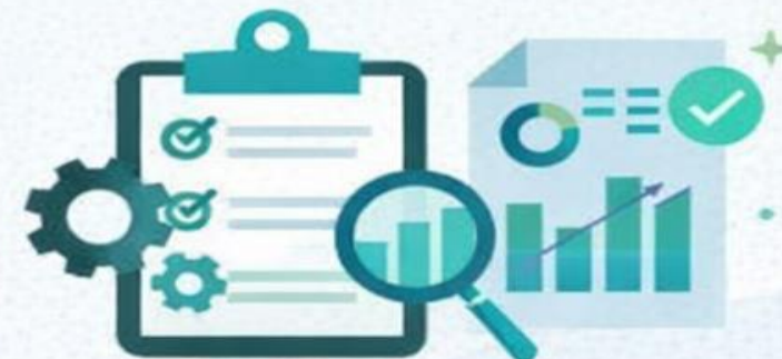
Mecanismos de controle