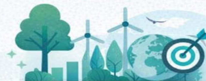
Foco de monitoramento