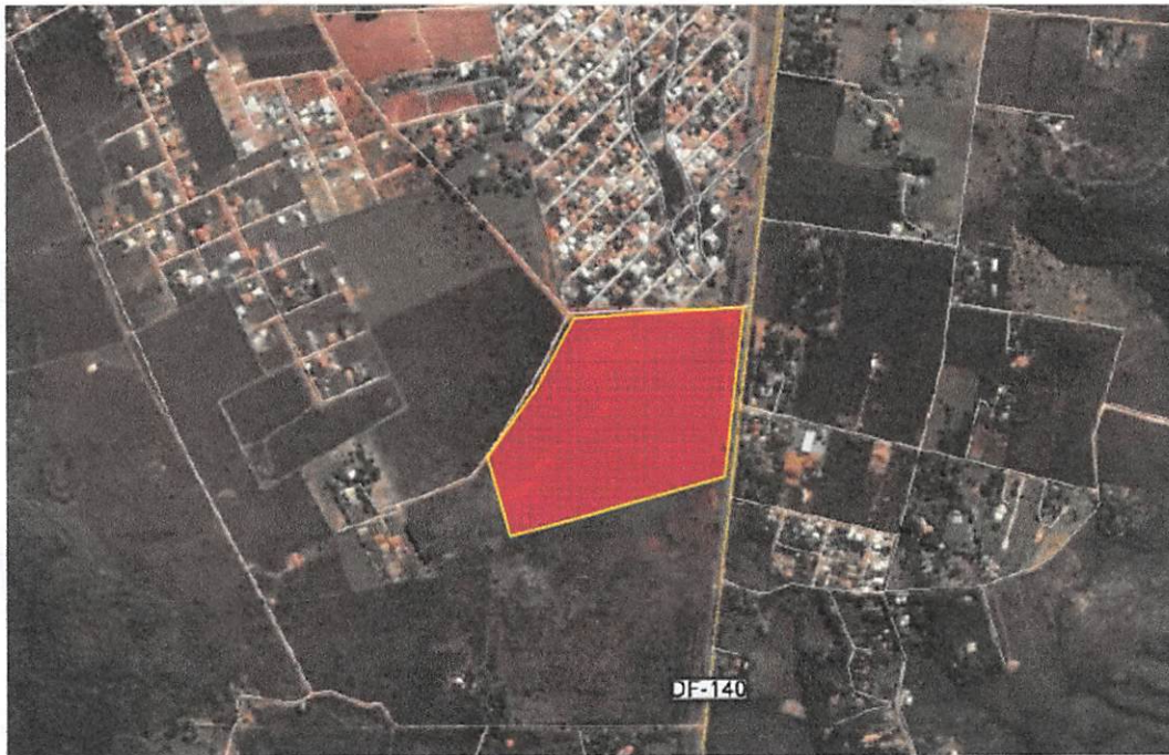
Imagem 01 - Imagem aérea do terreno