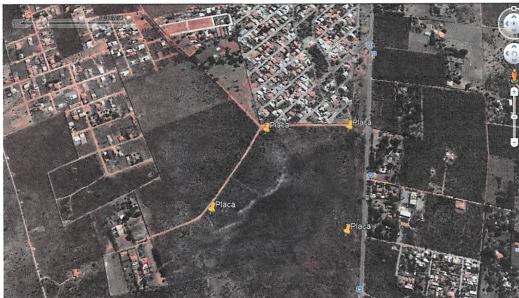
Imagem 02 - Localização das Placas