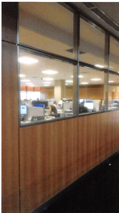
Imagem 02 – Divisória Existente