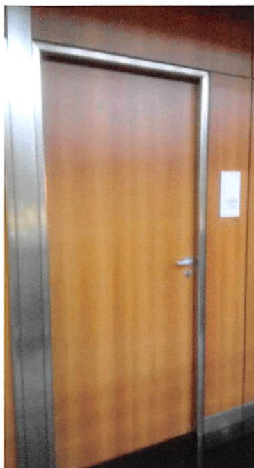
Imagem 01 – Porta Existente