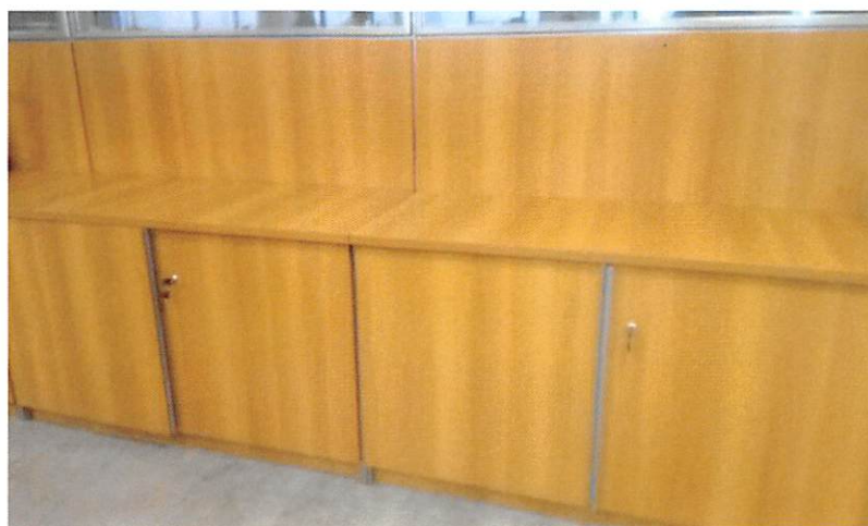
Imagem 03 – Armário Baixo Existente