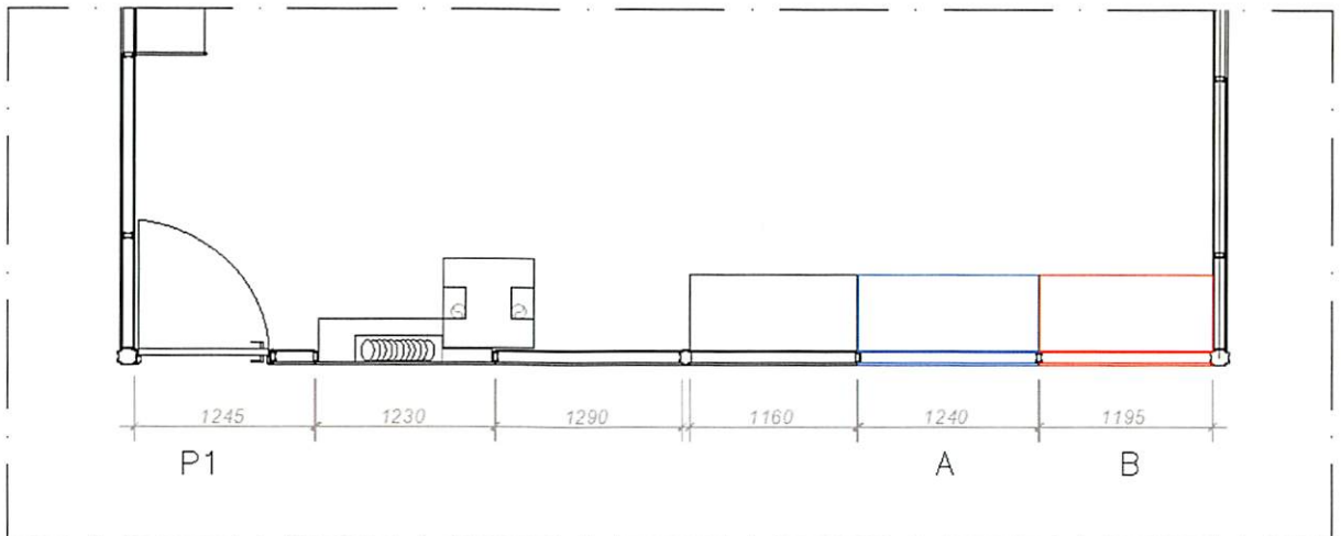
Planta Baixa – Situação Existente Medidas em milímetros