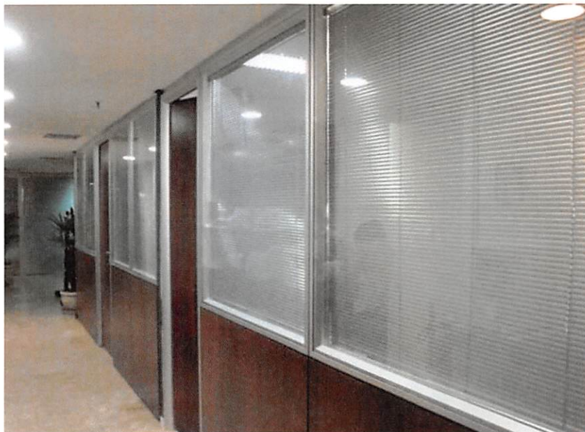
Imagem de divisória com persiana interna, Persiana Horizontal Alumínio 25mm

d) inserir persiana interna ao quadro de vidro duplo de 03 divisórias da sala do Secretário Executivo (identificadas em projeto anexo), modelo divisórias piso-teto c/ rodapé e bandeira, com quadro de vidro duplo incolor, h=2,85m, acabamento em bp madeirado noce monza, conforme imagem abaixo: