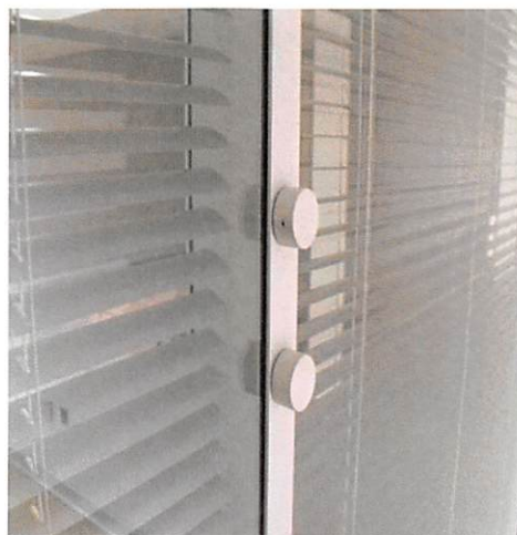
Sistema de abertura/fechamento da persiana na divisória