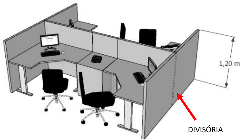
Imagem 01 - Situação Existente

O serviço deverá ser realizado após o horário de expediente (após às 18:00 horas e aos sábados).