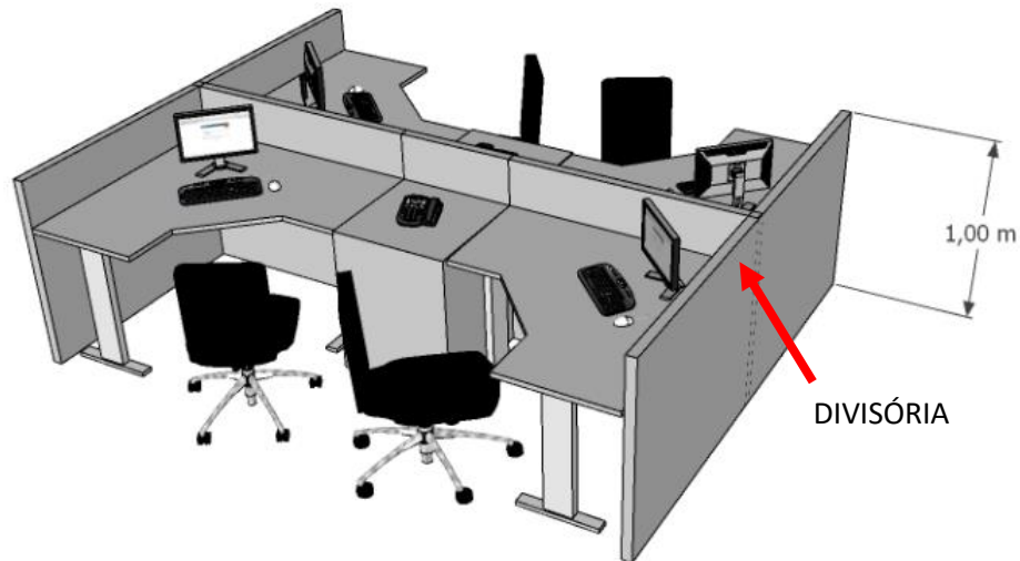
Imagem 02 - Situação Pretendida