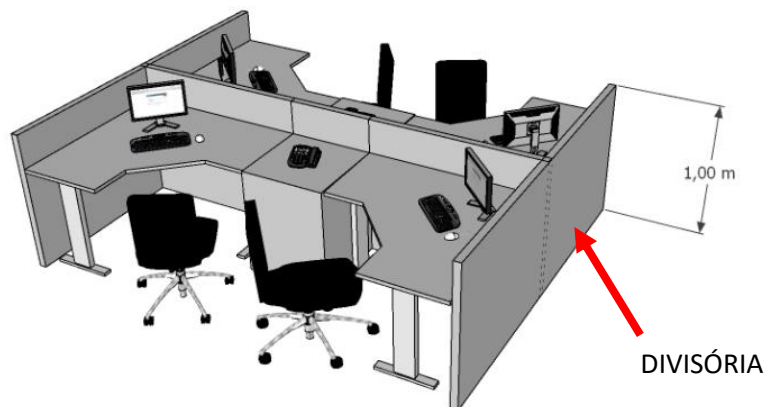
Imagem 02 - Situação Pretendida