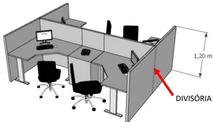
Imagem 01 - Situação Existente

O serviço deverá ser realizado após o horário de expediente (após às 18:00 horas e aos sábados).