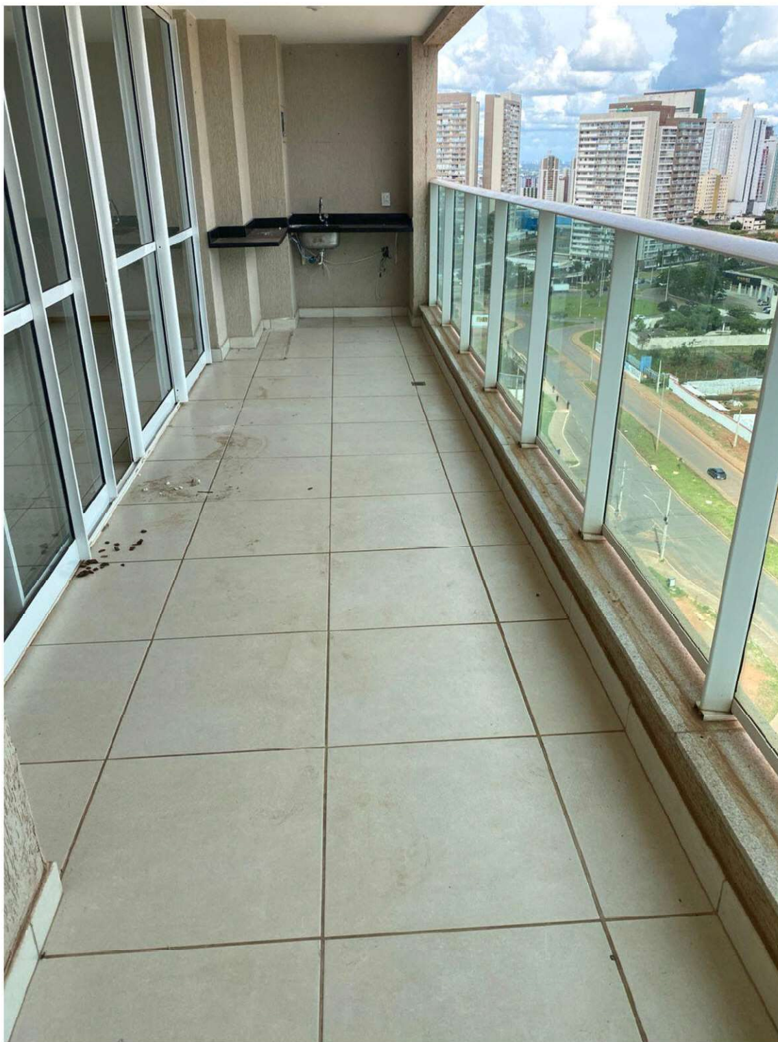
Fotos do imóvel POUPEX, localizado na Av. das Araucárias, Lt 4530, Bl. G, Ap. 1502, Península, Águas Claras Brasília/DF.