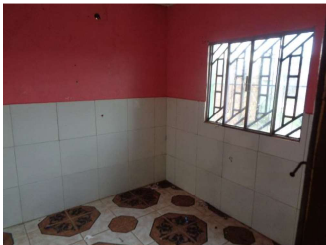
Foto do quarto