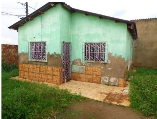
Foto da Fachada