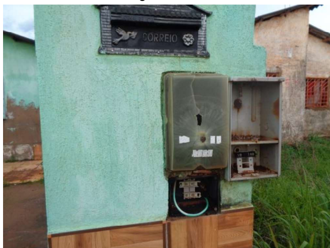
Foto do padrão e medidor de energia - danificado