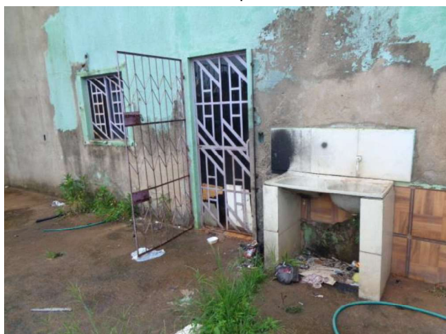
Foto da área de serviço