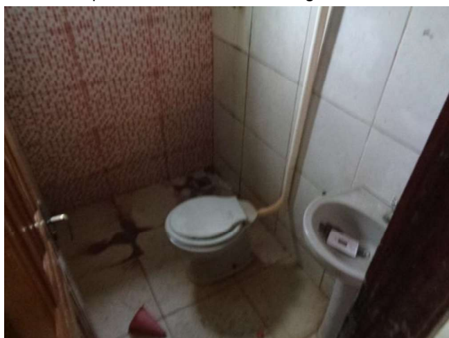
Foto do banheiro social