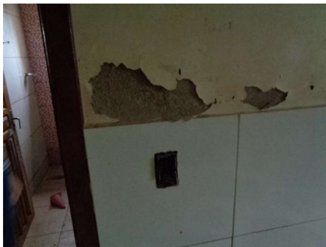
Detalhe da caixa de elétrica vazia e parede danificada