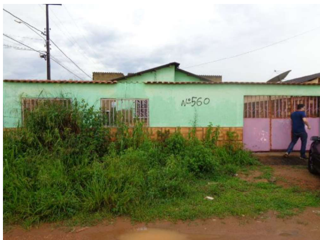
Foto do logradouro do imóvel