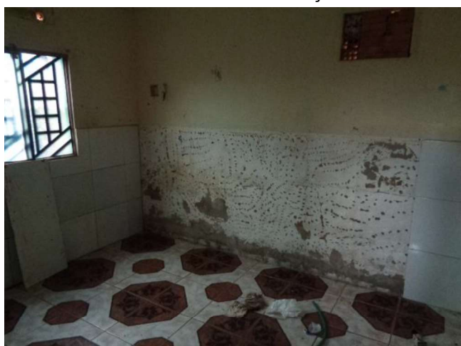
Foto do quarto com cerâmica retirada da parede