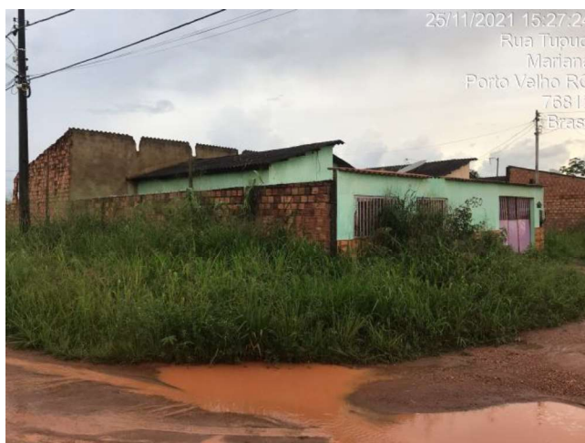
Foto da esquina