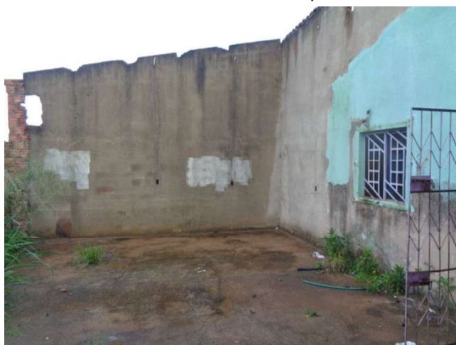
Foto da área externa