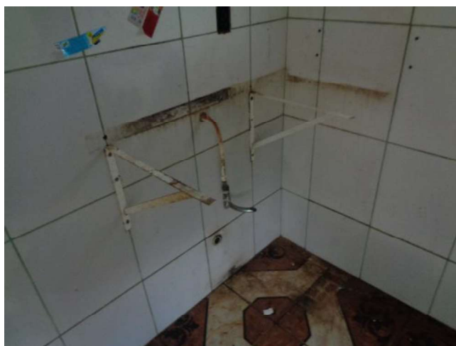
Foto da cozinha