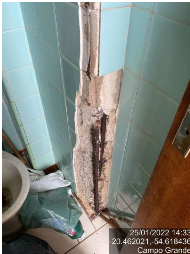
Foto 12 – patologia grave, corrosão de armadura, perda de seção da armadura e do pilar.