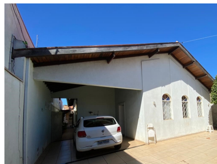
Foto 2 - Vista Frente