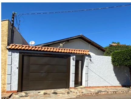
Foto 1 - Vista acesso