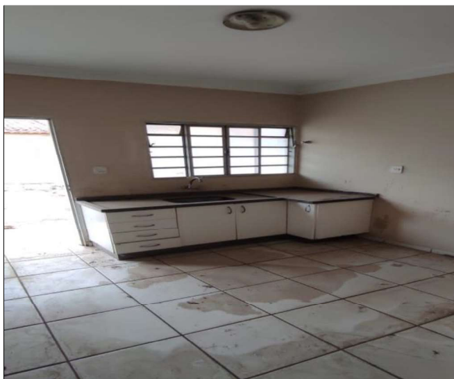
Foto 4 - Cozinha