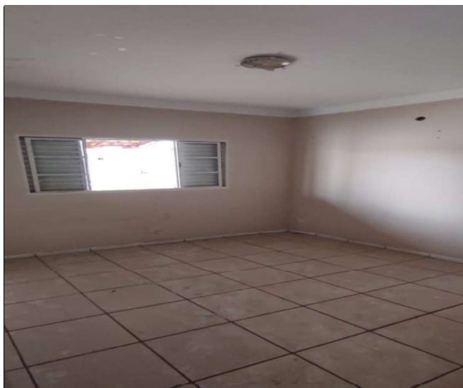
Foto 6 - Quarto