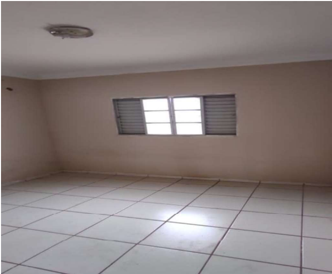
Foto 7 - Foto 7 - Quarto