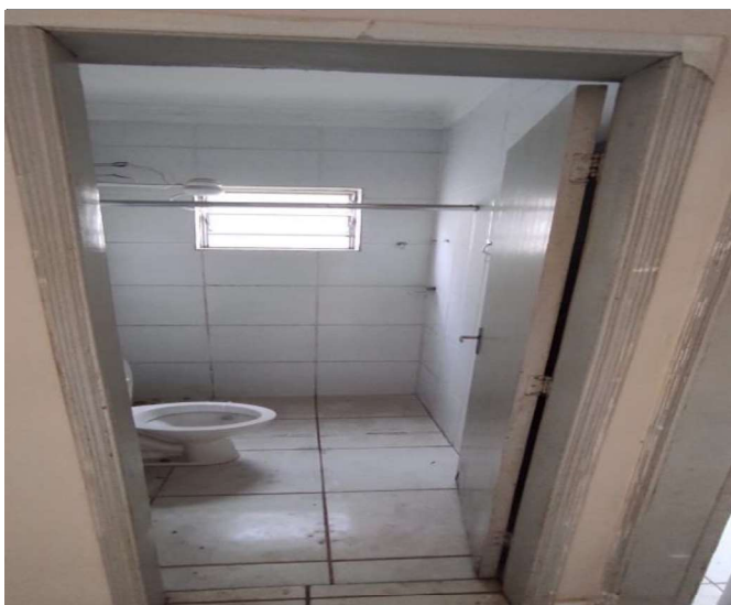
Foto 5 - Foto 5 - Banheiro Social