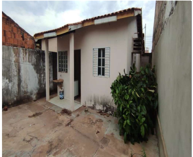
Foto 8 - Fundos e Área de Serviço