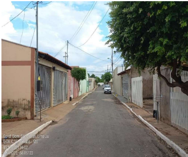
Foto 2 - Logradouro - frente ao imóvel