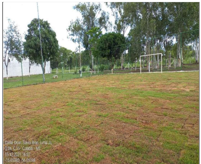
Foto 11 - Área Verde do Condomínio

Cond. Dom. Sávio Bran Lima Ju Q.06, C.15 - Curitiba - MT 15.12.2021 16:07 -15.65382, -56.05188