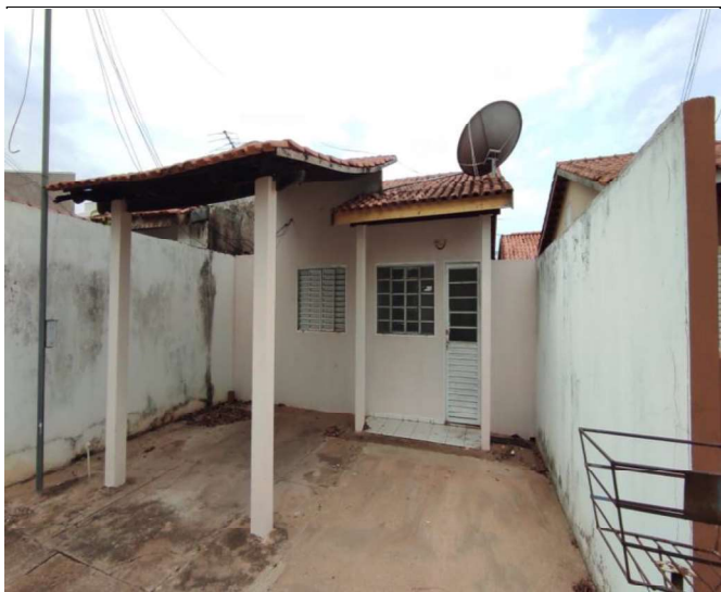
Foto 1 - Fachada