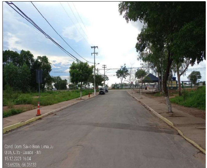
Foto 9 - Portaria do Condomínio

Cond. Dom. Sávio Bran Lima Ju Q.06, C.15 - Curitiba - MT 15.12.2021 16:04 -15.65206, -56.05133