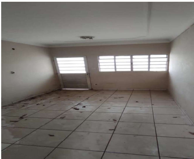
Foto 3 - Sala de Estar