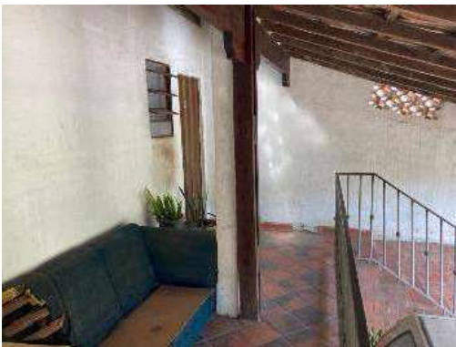
Vista da Varanda