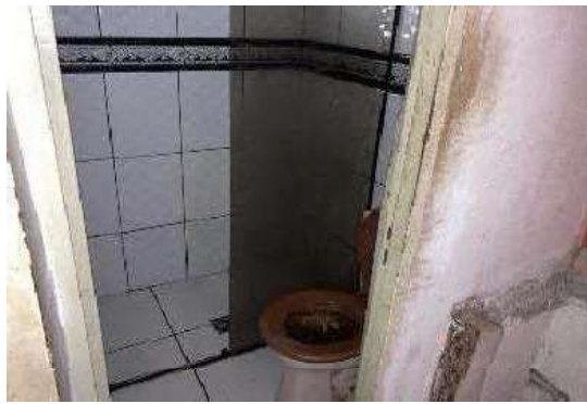
Vista do Banheiro Social