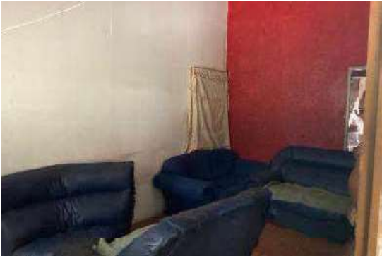
Vista da Sala 1