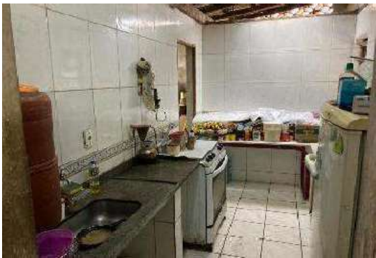
Vista da Cozinha