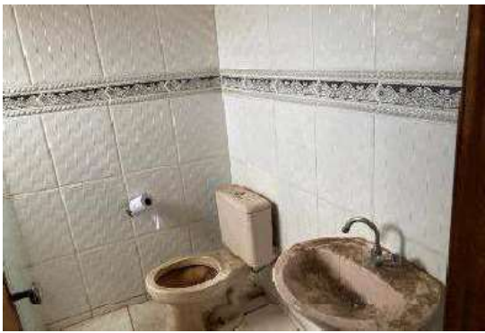
Vista do Banheiro Privativo