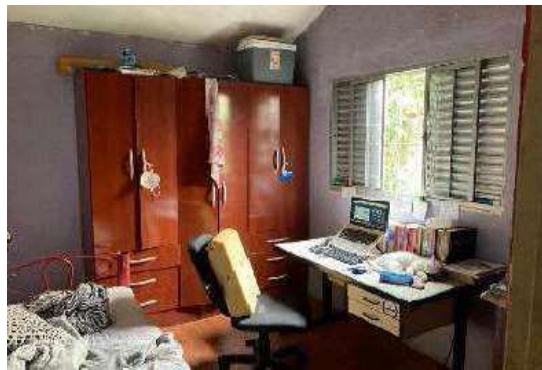
Vista do Quarto 01