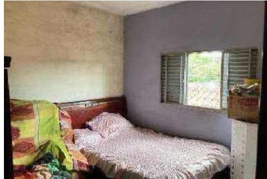
Vista do Quarto 03