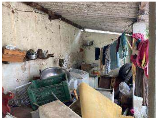
Vista da Área de Serviço