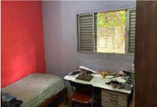
Vista do Quarto 02