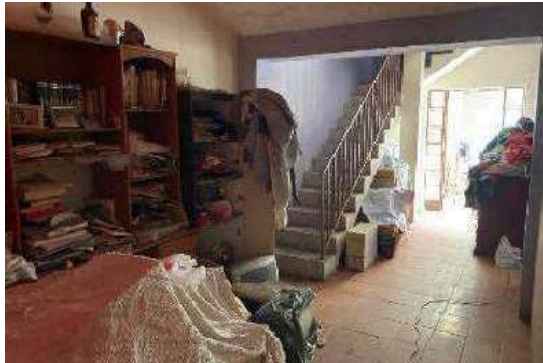
Vista da Sala 2