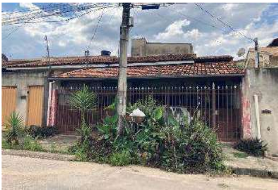
Vista da Fachada