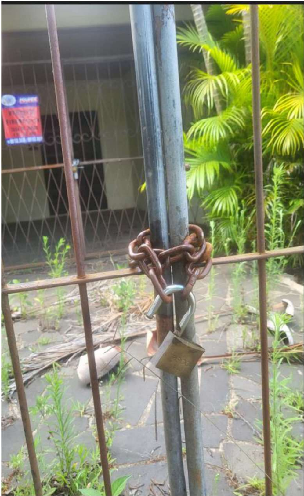
CADEADO PORTÃO EXTERNO – ESTAVA EMPERRADO NÃO PERMITINDO ACESSO AO LADO INTERNO DO IMÓVEL