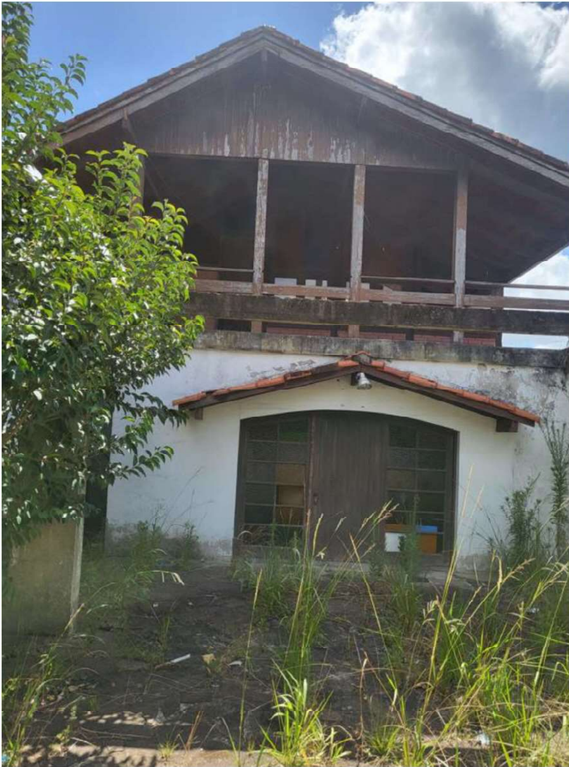
FUNDOS DO IMÓVEL