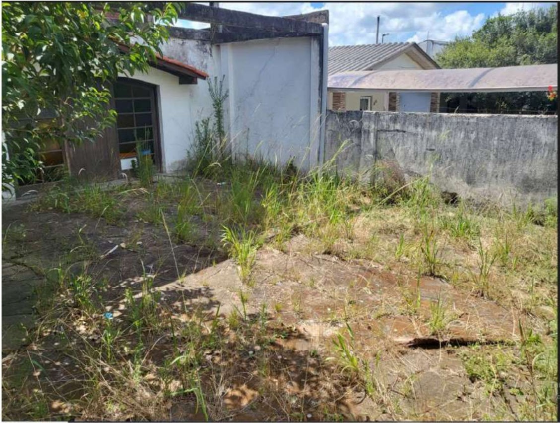
FUNDOS DO IMÓVEL