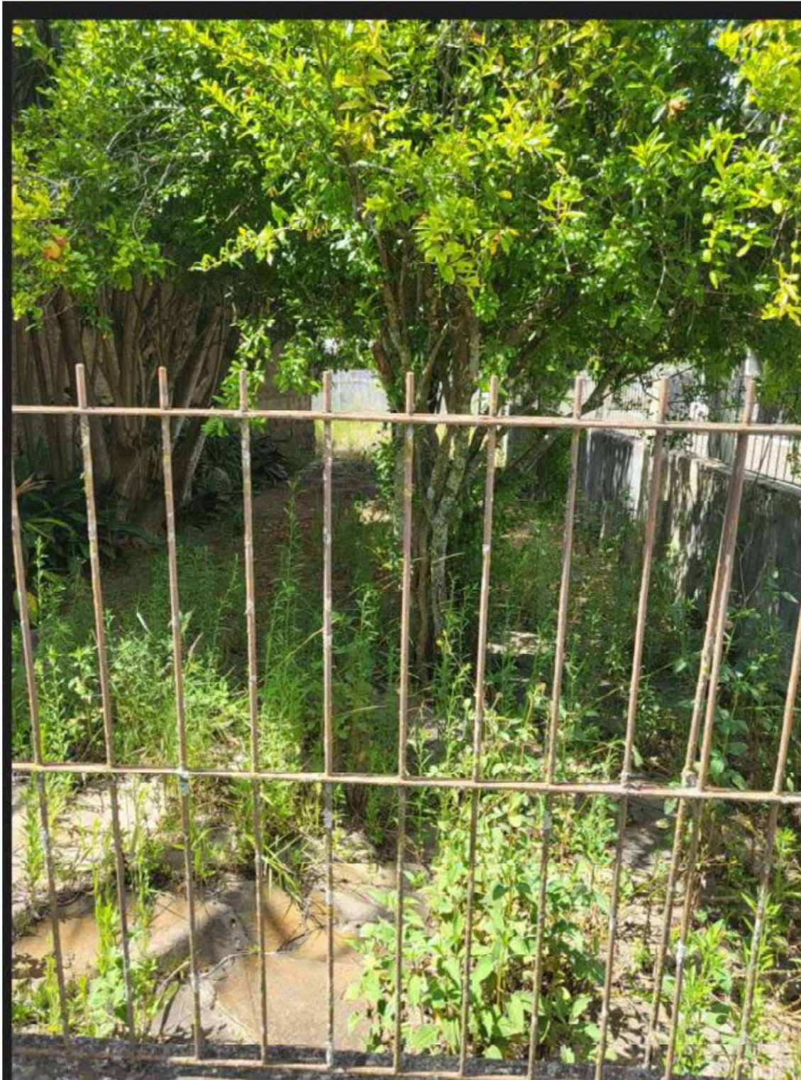
LATERAL DA RESIDÊNCIA