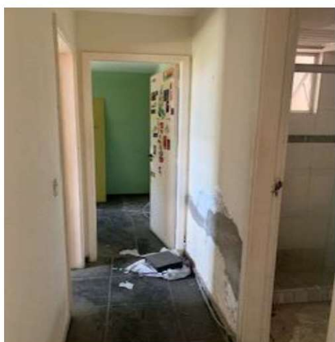
Hall de circulação