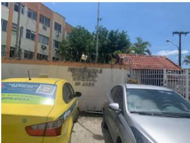
Numeração do condomínio