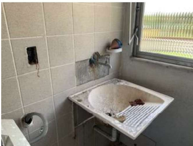
Área de serviço