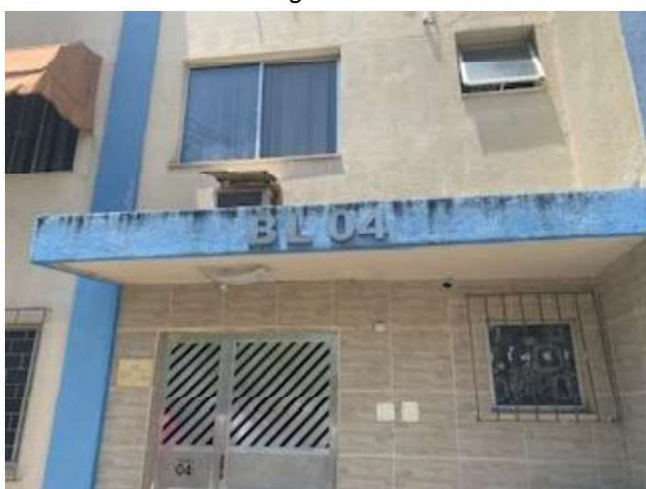
Numeração do bloco