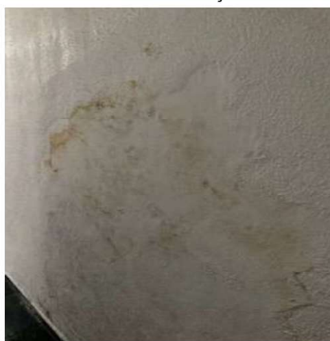
Infiltração no banheiro para o corredor de circulação do prédio