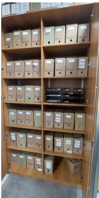
Imagem do armário existente com prateleiras

6.2. Remanejar 06 (seis) prateleiras de 01 (um) armário alto em MDF e prever a colocação de tapa furos na tonalidade Italian Noce da marca Duratex;