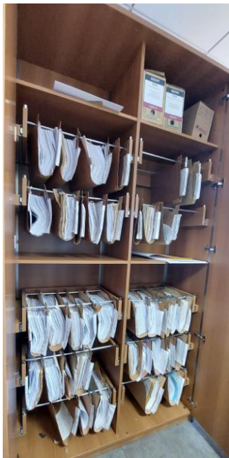
Imagem do armário existente com as hastes para pastas suspensas

6.1. Remanejar 10 (dez) hastes para pastas suspensas de 01 (um) armário alto em MDF e prever a colocação de tapa furos na tonalidade Italian Noce da marca Duratex.