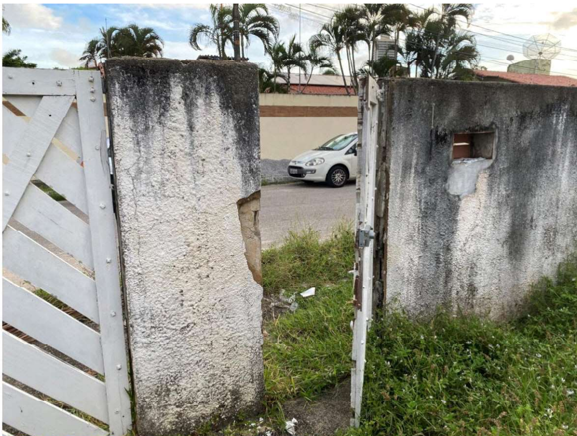
Fotos imóvel POUPEX localizado na Rua Professor Gerson Dumaresq, Quadra 12, Lote 12. Capim Macio – Natal/RN