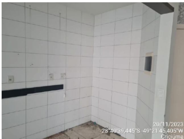
20/11/2023 -28°40'39,445"S -49°21'45,405"W Criciúma