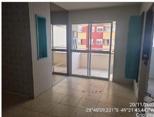
20/11/2023 -28°40'39,221"S -49°21'45,442"W Criciúma