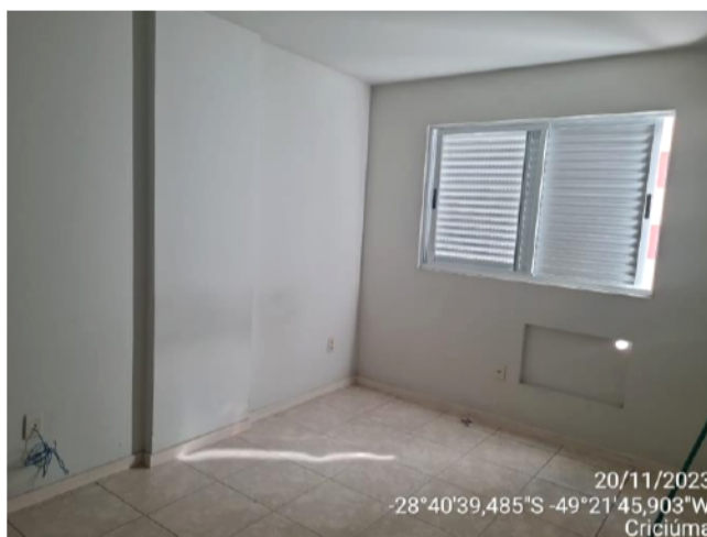
20/11/2023 -28°40'39,485"S -49°21'45,903"W Criciúma