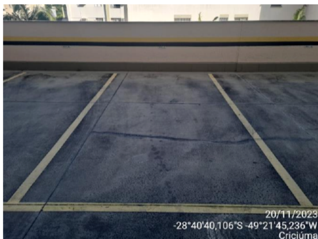
Foto 12 - VAGA DE GARAGEM