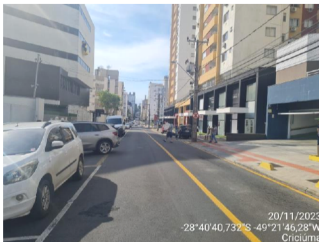
20/11/2023 -28°40'40,732"S -49°21'46,28"W Criciúma