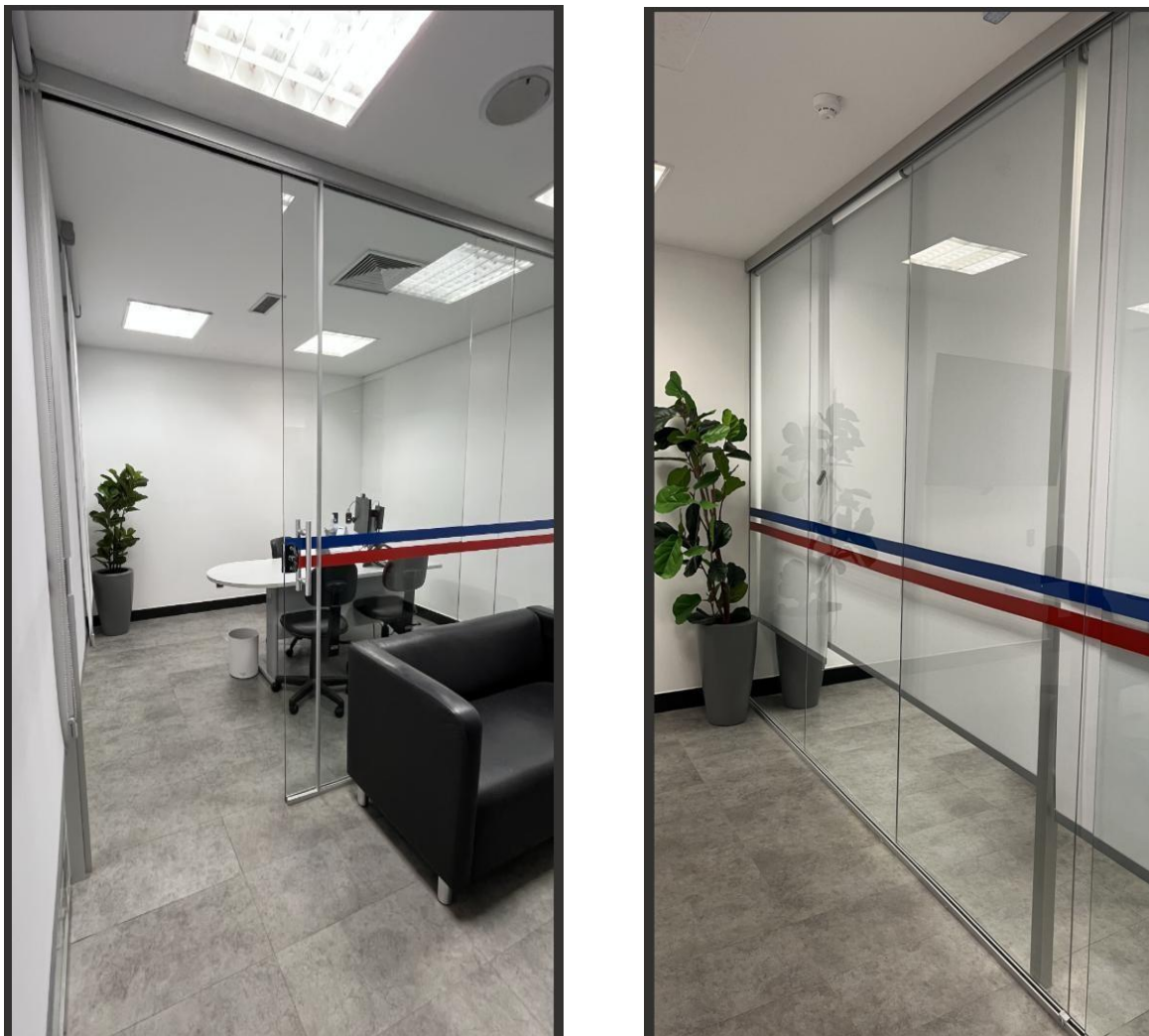
Figura 3 - Imagem ilustrativa com as faixas e puxador DORMA

5.4 O puxador tubular da porta de correr deve seguir o modelo DORMA, já utilizado nas portas de vidro da Sede (confirmar com a equipe de Manutenção).