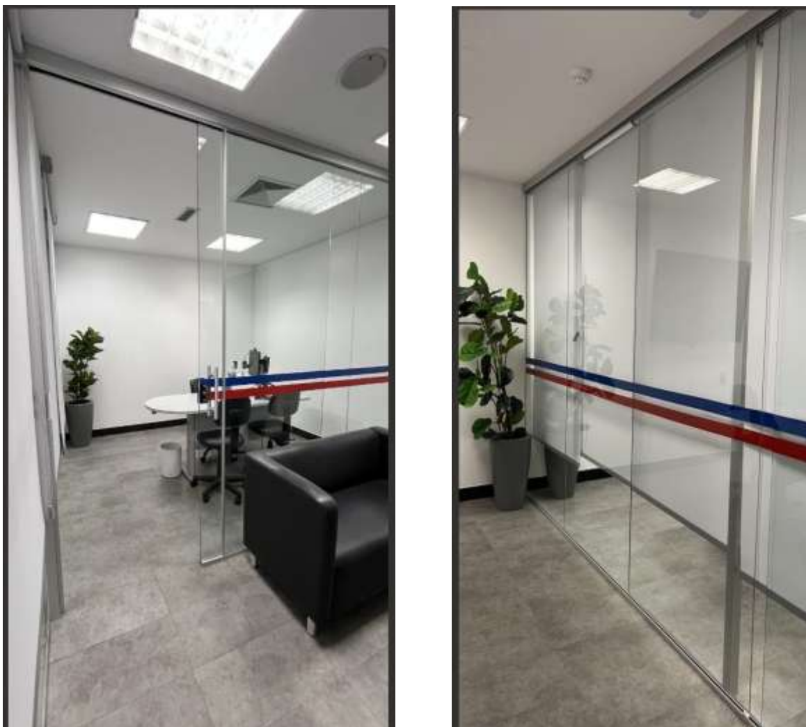
Figura 3 - Imagem ilustrativa com as faixas e puxador DORMA

5.6 O puxador tubular da porta de correr deve seguir o modelo DORMA já utilizado nas portas de vidro do Edifício (confirmar com a equipe de Manutenção da Sede todas as características).