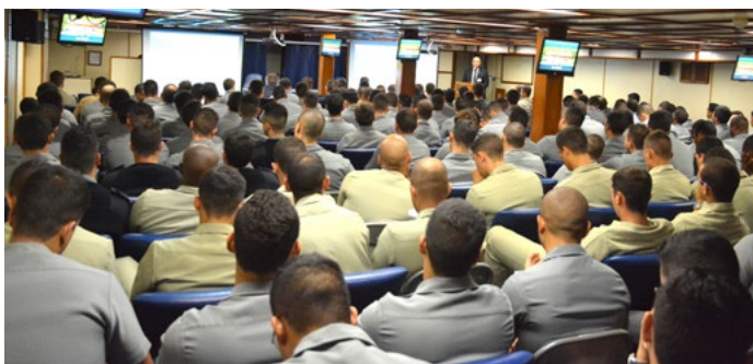
200 guardas-marinha assistiram a apresentação sobre a FHE e a POUPEX no Navio Escola Brasil

ocorreu no Navio Escola Brasil, utilizado para a instrução de marinheiros e que estava atracado em Niterói (RJ). A plateia teve a oportunidade de conhecer melhor os produtos e serviços das instituições e dirimir dúvidas.