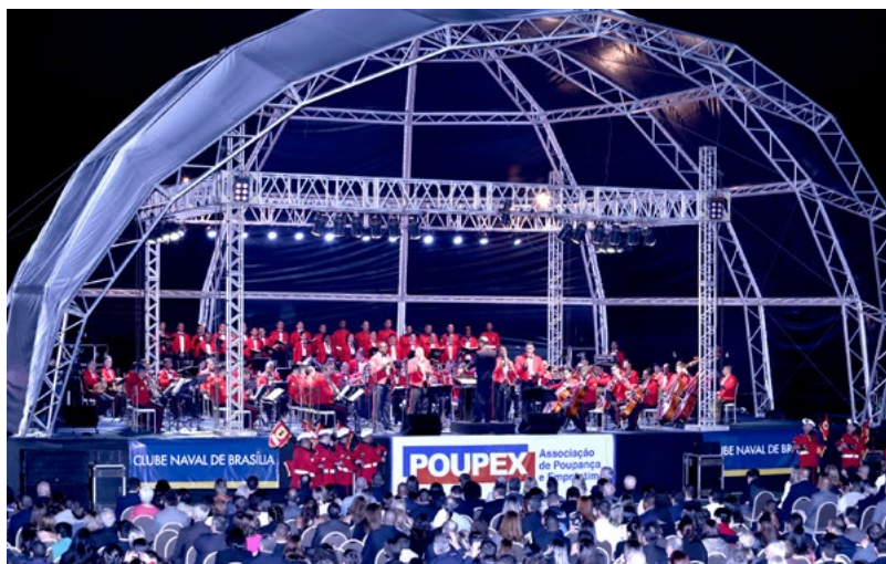
Banda Sinfônica do Corpo de Fuzileiros Navais em apresentação no Clube Naval de Brasília

C omo parte das comemorações do 152º aniversário da Batalha Naval do Riachuelo, data Magna da Marinha, foi realizada uma apresentação da Banda Sinfônica do Corpo de Fuzileiros Navais, para militares e convidados, no Clube Naval de Brasília. O evento foi promovido em 7 de junho pelo Comando do 7º Distrito Naval, que conta com o apoio da FHE e da POUPEX. ■